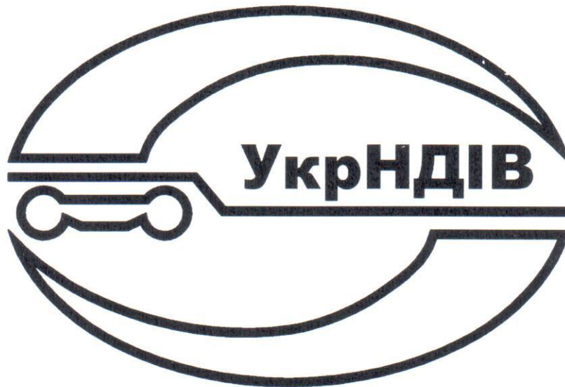
Рисунок 1 – Загальна форма знака відповідності

6 На рисунку 1 показано загальне зображення знака відповідності.